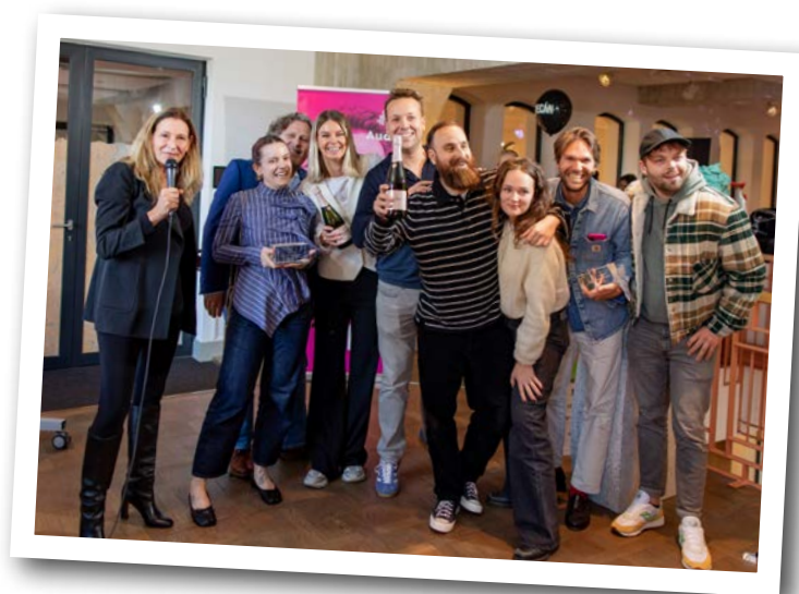
Winnaars Audify Award Beste Audiocommercial 2024